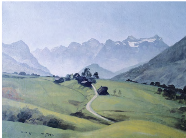
Meinard Iten – Ägerital und Urnerberge

Antragsformulare können bei der Bürgerkanzlei bezogen und zuhänden der Ortskundlichen Fachgruppe eingereicht werden.