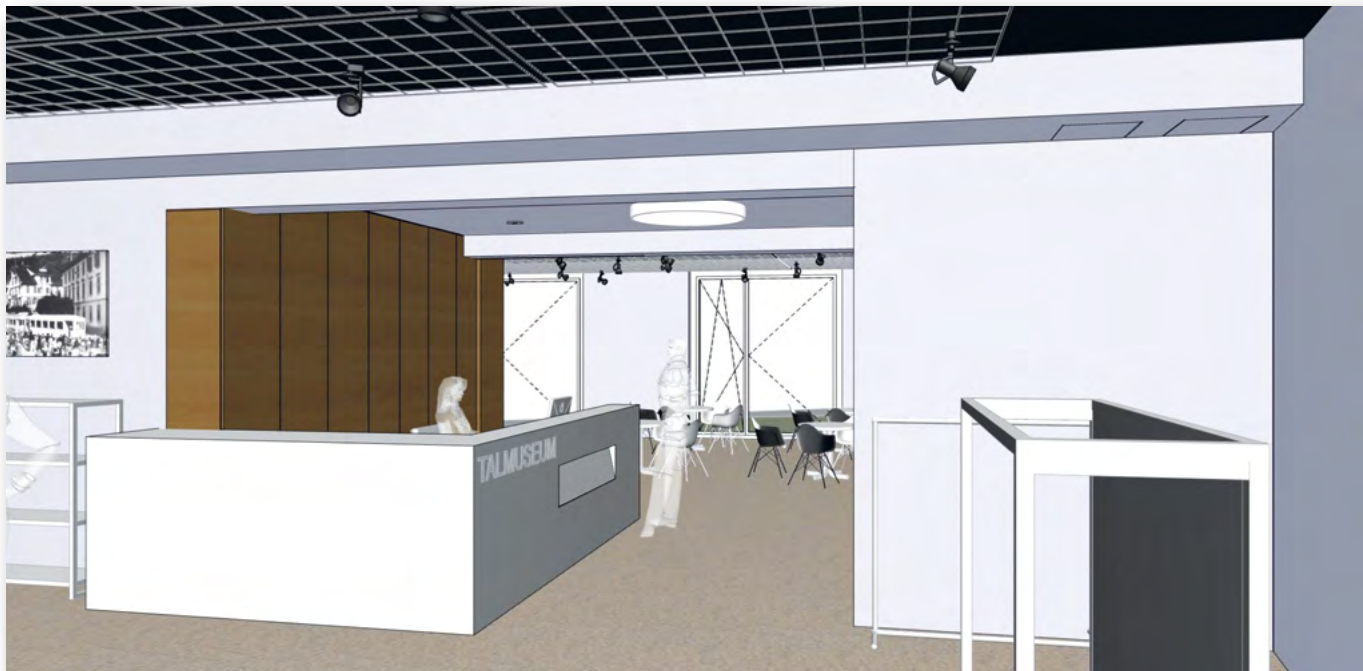
Visualisierung Eingang Talmuseum Euw