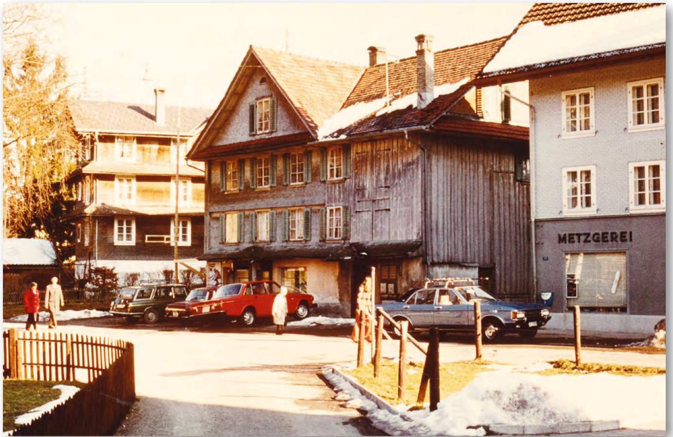
Zugerbergstrasse in den 1970ern