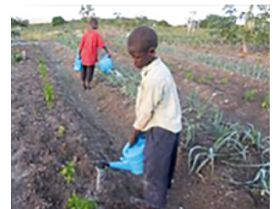
Schulgärten lehren leben