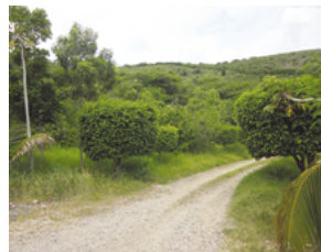
Zehn Jahre später