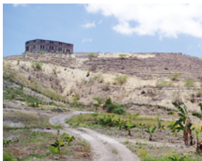
Umweltzentrum wird gebaut